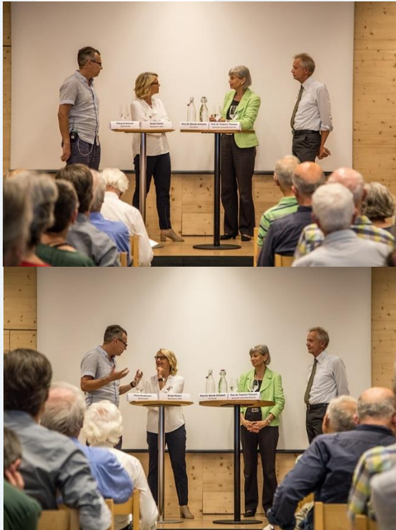
3. Juli 2019, Podiumsdiskussion: «Flug in die Klimakatastrophe? Massnahmen für die Schweiz»