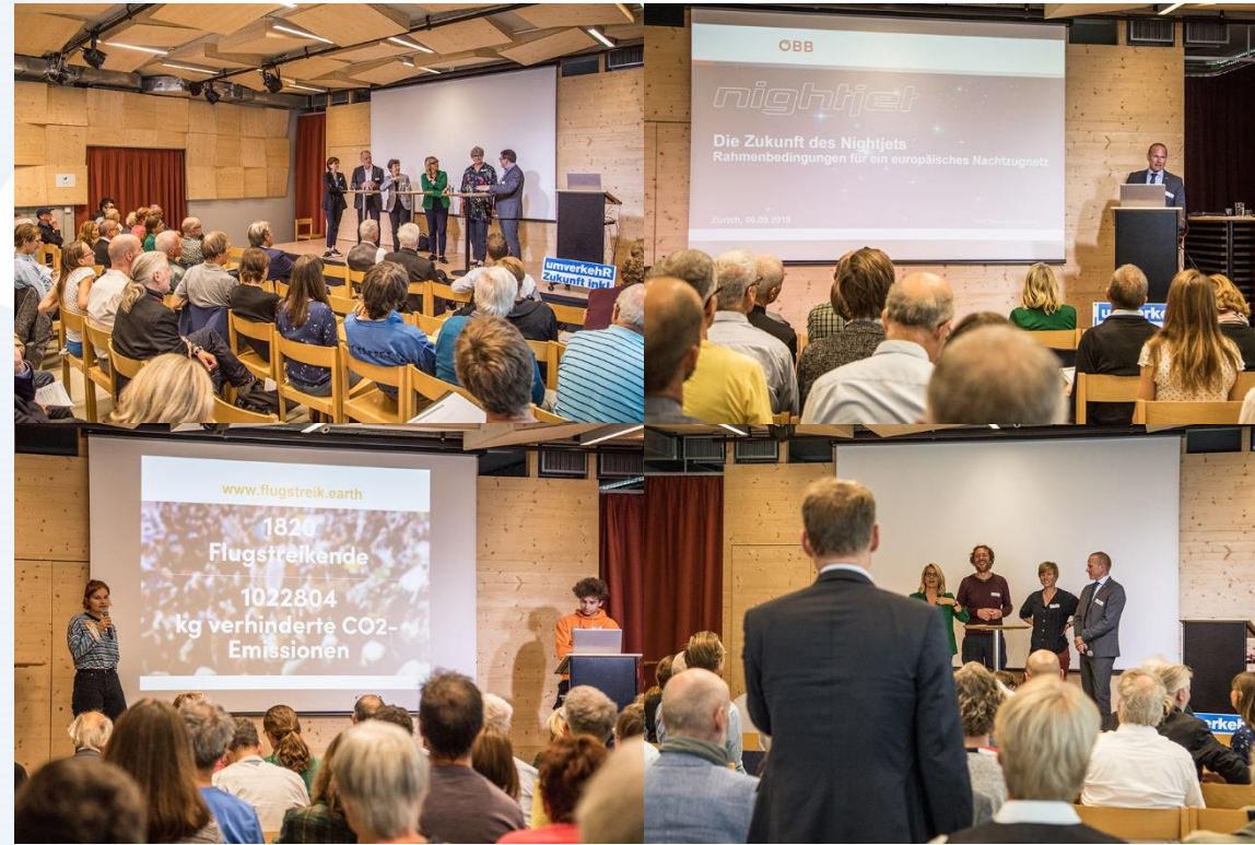
6. September 2019, Fachtagung: «Flugverkehr und Klimaschutz: Fakten und Forderungen»